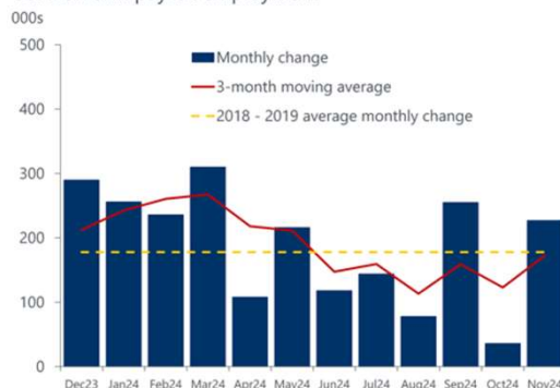
US: Nonfarm payroll employment

Performances dividendes réinvesties arrêtées au 6 décembre 2024.