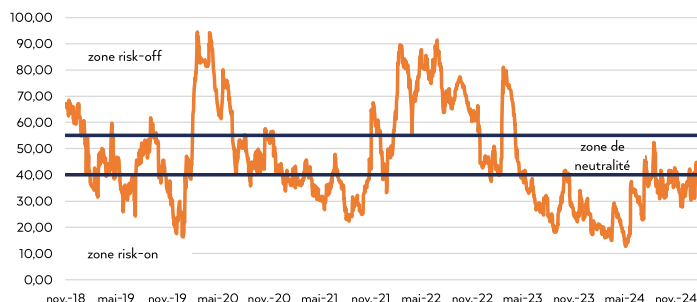
SAMIR® zone euro